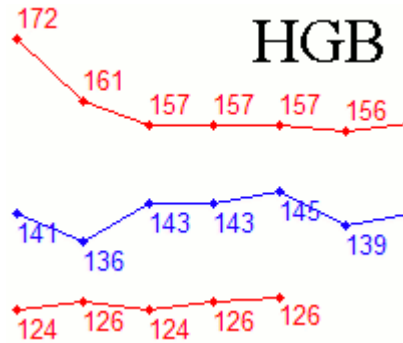
Стероидный паспорт спортсмена